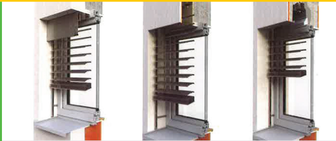
S krytem z hliníkového plechu